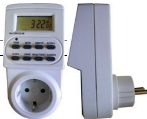
Таймер-розетка TS ED1